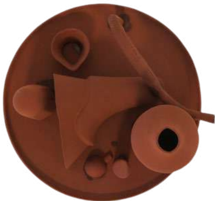
Agrégats domestiques, 2024. Faïence

En montrant comment nous construisons, réparons, détruisons et recyclons, DISCORDANCE est une invitation à considérer nos pratiques comme des indices sur nos valeurs, nos hiérarchies et nos décisions.